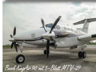
Beech King Air 90 mit 5-Blatt MTV-27