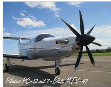
Pilatus PC-12 mit 7-Blatt MTV-47